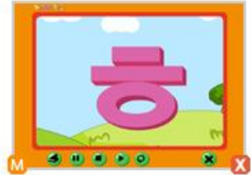
1_5. ㅇ 노래