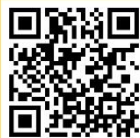
1_5. ㅕ 노래