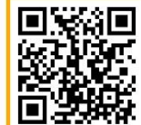
1_5. ㅇ 노래