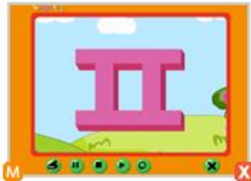
1_5. ㅕ 노래