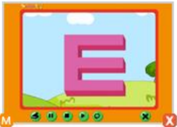
1_5. ㅓ 노래